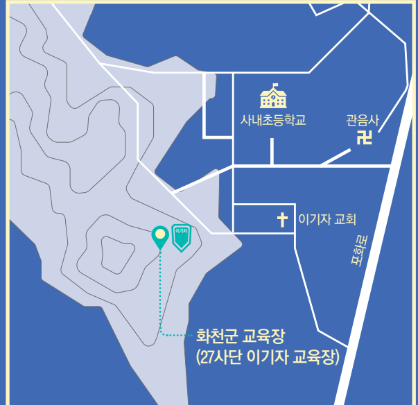
화천군 교육장 (27사단 이기자 교육장)