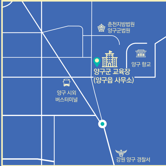
양구군 교육장 (양구읍 사무소)